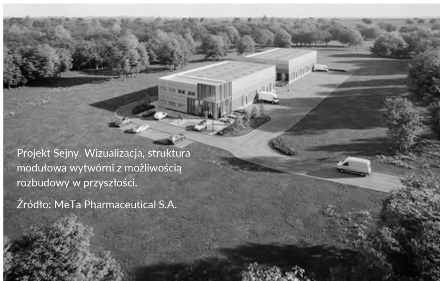
Projekt Sejny. Wizualizacja, struktura modułowa wytwórni z możliwością rozbudowy w przyszłości.